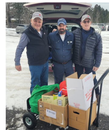
Légion Royale Canadienne