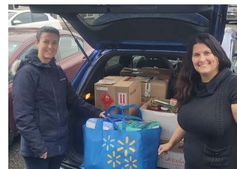
École secondaire Wilfrid Léger