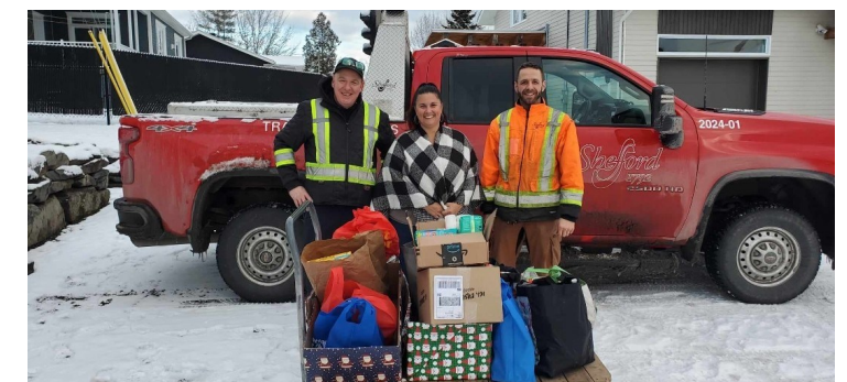
Municipalité du Canton de Shefford